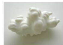
10 / JUGNET + CLAIRET "Le nuage 3" Carré Blanc (sous réserve) 7 rue d'Angrin