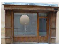
19 / Audrey MARTIN "MzKz" Singer Place Estoup