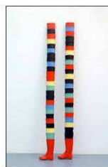
1 / Étienne BOSSUT "Chaque matin" "Collier" Office de tourisme Place du Foirail