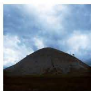
24 / Lucien PELEL "Allègre#z" "Le Griffon" Maison de la Région (à l'intérieur) 9 bis bd Théophile Roussel