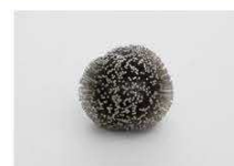
14 / Laurette ATRUX-TALLAU "série de sculpture en pointe d'acier" Cabinet de M. Brun 19 rue Basse (angle rue des Trois Mulets)