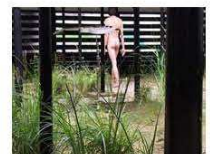
11 / Céleste BOURSIER-MOUGENOT / Enna CHATON "Téléscopages (vidéo)" Frou Frou 21 rue d'Angrin