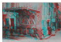
2 / LES ÉCRANS DE LOZÈRE Installation et web documentaire "Mende, vision(s) urbaine(s)" Optic 2000 6 Rue du Soubeyran