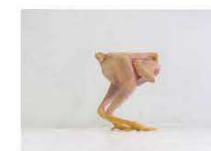
4 / La cellule (Becquemin&Sagot) "Poulet n°78121" Magasin en bois 15 rue du Soubeyran