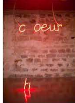
21 / Armelle CARON "c'oeur" Boucherie rouge 3 rue Notre-Dame