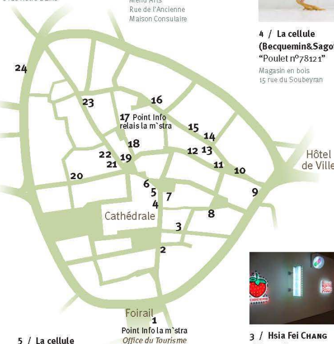
5 / La cellule (Becquemin&Sagot) "Le lèche-cul autoportrait" Office du commerce Place de la République