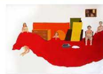
13 / Enna CHATON "Dessins" Magasin en bois 20 rue Basse