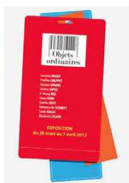
22 / École supérieure des Beaux-Arts de Nîmes Magasin bleu 6 rue Notre-Dame