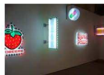
3 / Hsia Fei CHANG "Urumqi" Magasin violet et or 7 rue d'Aurillac