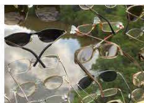
20 / Seamus FARRELL "view us - you see me"