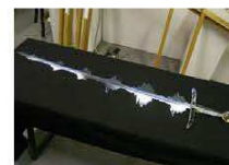
8 / LE GENTIL GARÇON "Le propre de l'Homme" 48FM Place au Blé