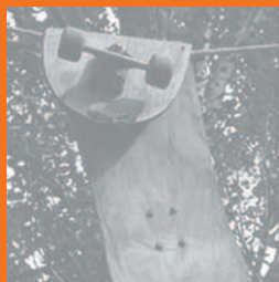
Skate qui sèche, 2004-2011 (objet poétiquement modifié)