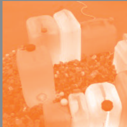
Fort "R"Esse, 2005

En partenariat avec le Musée régional d'art contemporain Languedoc Roussillon / Sérignan