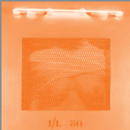
Iron Lady, 2000