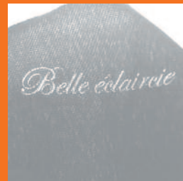
Gravure sur pétale, 2013

www.sylvetteardoino.com Résidence d'artiste à Mende en 2013, à destination des écoles élémentaires et des maisons de retraite de la Ville de Mende. Titre : "record absolu de douceur(s)".