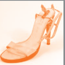
Saint-Moritz, 1988 (Soulier Jourdan et figure en plastique)

En partenariat avec le FRAC Languedoc Roussillon