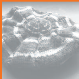
Oursin continué en tricot, 2011

www.jeremygobe.info Œuvres présentées : Corail restauration Oursin continué en tricot Coraux terre (*2) Corail sable : Corail terre et meuble Etoile de mer Corail gratté Les dessins : les grand aigles