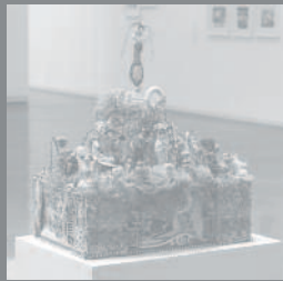
Swan Cake, 2003