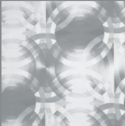
Sans titre, 2002